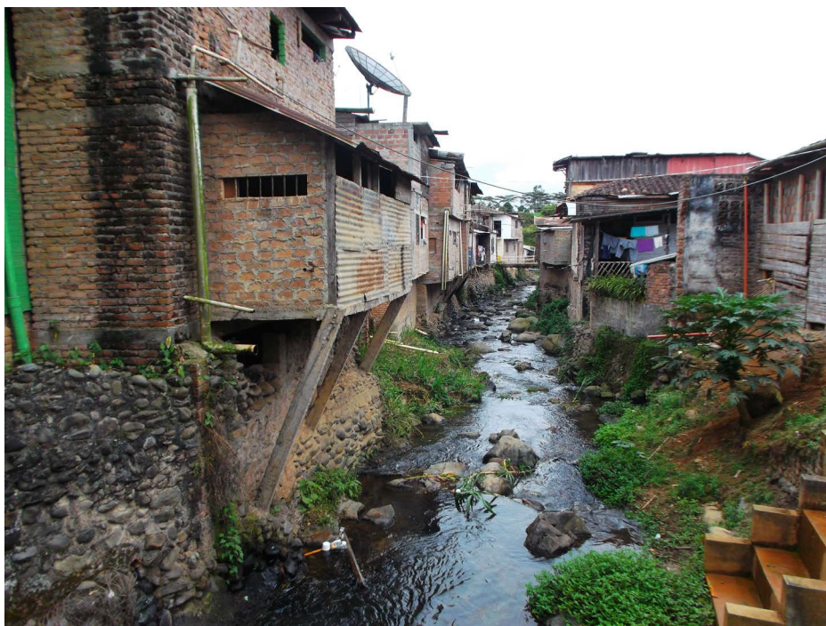
Figura 3. Vertimiento de aguas domésticas y residuos a fuentes de agua. Municipio de La Cumbre