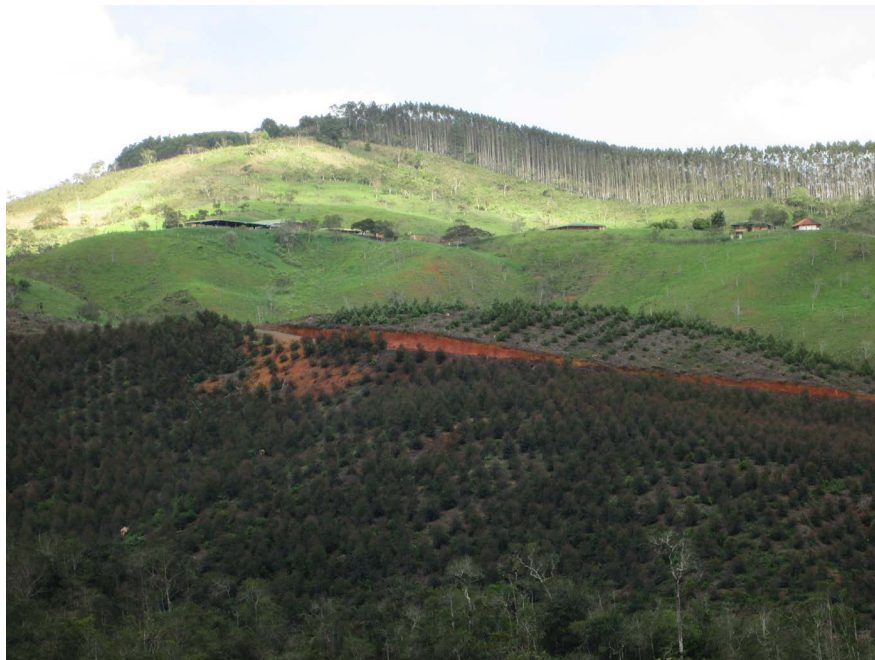
Figura 2. Monocultivos de pino y eucalipto, deforestación, erosión del suelo y ganadería en ladera. Municipio de Dagua