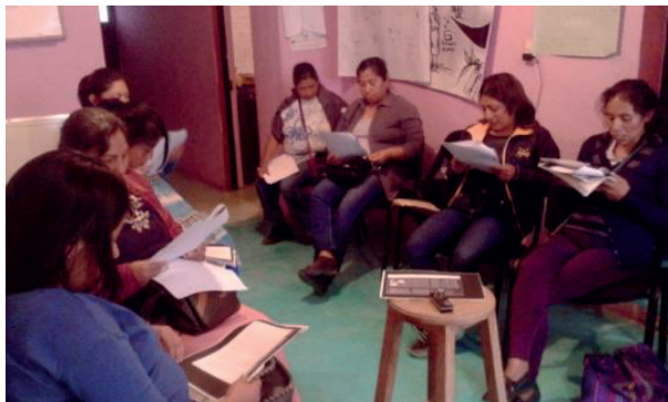
Figura 3. Taller experiencia como trabajadoras del hogar indígenas en CEDACH